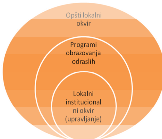
Слика 1. Стратешка усмјерења образовања одраслих у општини Модрича

Као закључак проведене социо-економске анализе општине Модрича са становишта образовања одраслих и SWOT анализе, идентификована су три кључна стратешка усмјерења.